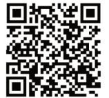
Declaração IFRA IFRA Declaration